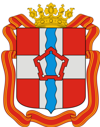
СХЕМА ВОДОСНАБЖЕНИЯ И ВОДООТВЕДЕНИЯ СЕЛЬСКОГО ПОСЕЛЕНИЯ ПОКРОВСКОЕ ОМСКОГО МУНИЦИПАЛЬНОГО РАЙОНА ОМСКОЙ ОБЛАСТИ