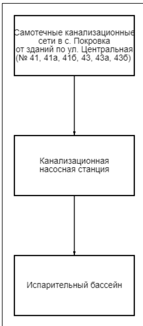
Рисунок 2.1.1 – Структурная схема централизованного водоотведения СП Покровское

На территории СП Покровское эксплуатацию объектов ЦС ВО осуществляет единственная организация – МУП «СКБУ». В состав объектов, эксплуатируемых МУП «СКБУ» на территории СП Покровское, входят: